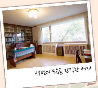
생전의 모습을 간직한 서재