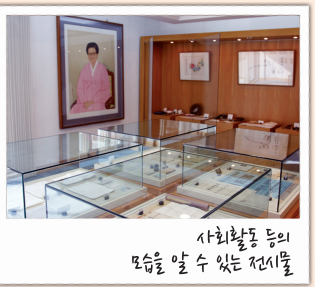
사회활동 등의 모습을 알 수 있는 전시물