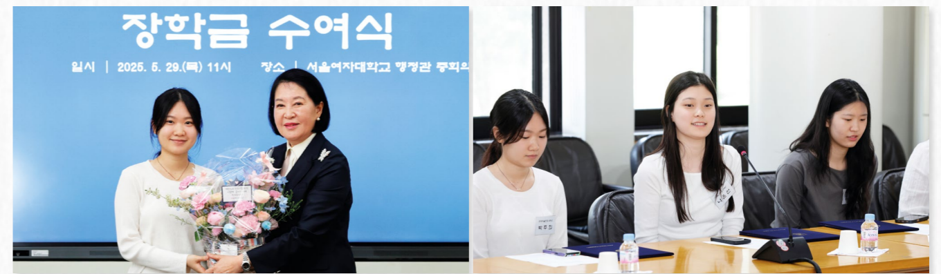
여전도회전국연합회, 장학금 수여식 진행

5월 23일, 행정관 중회의실에서 (사)대한민국국가조찬기도회의 학식비 기탁식 및 장학금 수여식이 열렸다. 1968년 제1회 국가기도회를 시작으로 활동해온 평신도 기도단체인 조찬기도회는, 2022년부터 본교에 장학금과 학식비를 기탁하며 학생들의 안정적인 학업 환경 조성을 지원하고 있다. 올해에도 기독교 여성 인재 양성을 위해 내·외국인 학부생 6명을 선발해 800여만 원의 장학금을 전달했으며, '천원의 아침밥' 프로그램 운영을 위한 학식비 1,200만 원도 함께 기탁했다.